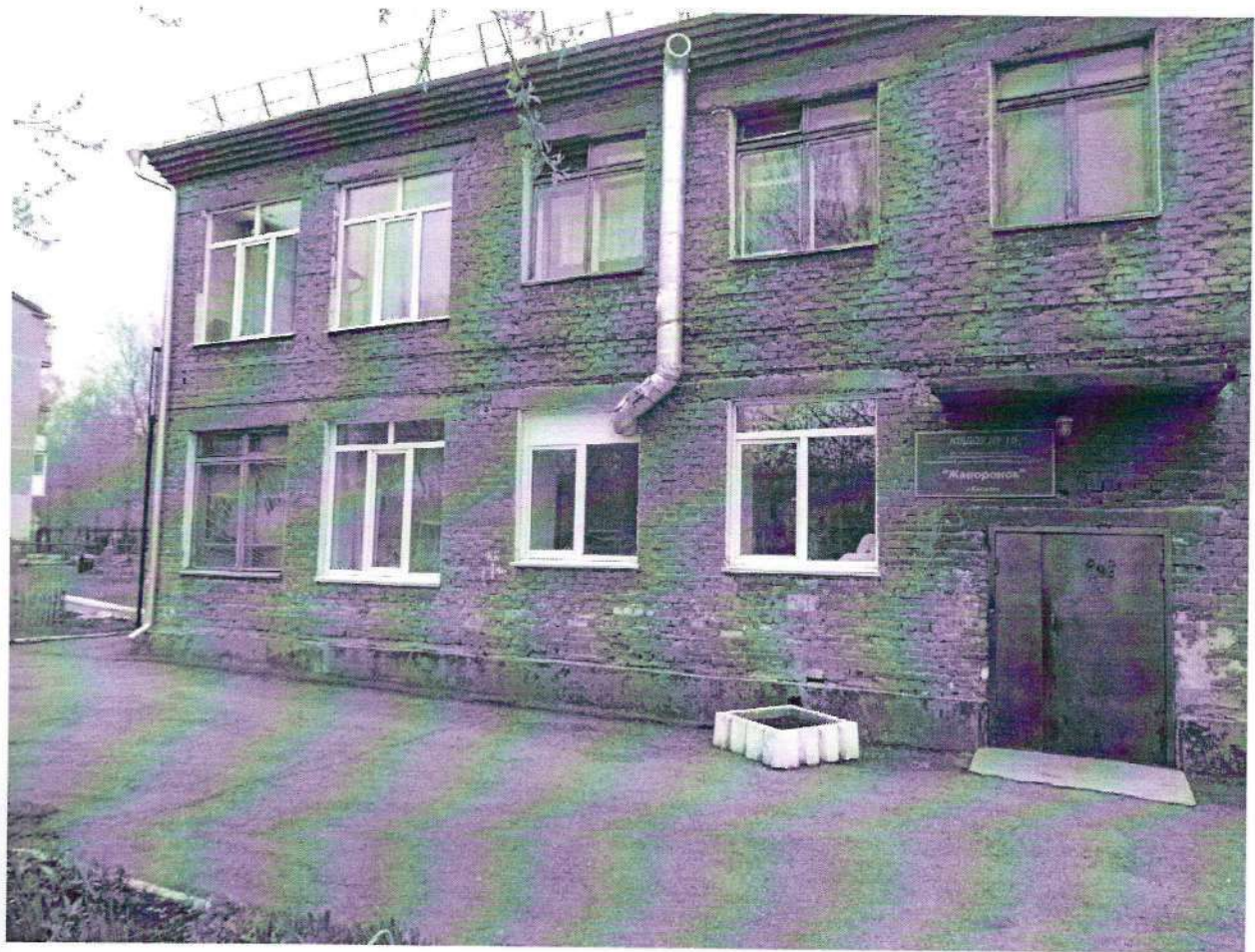
Центральный вход. Левая сторона здания. Фото №1